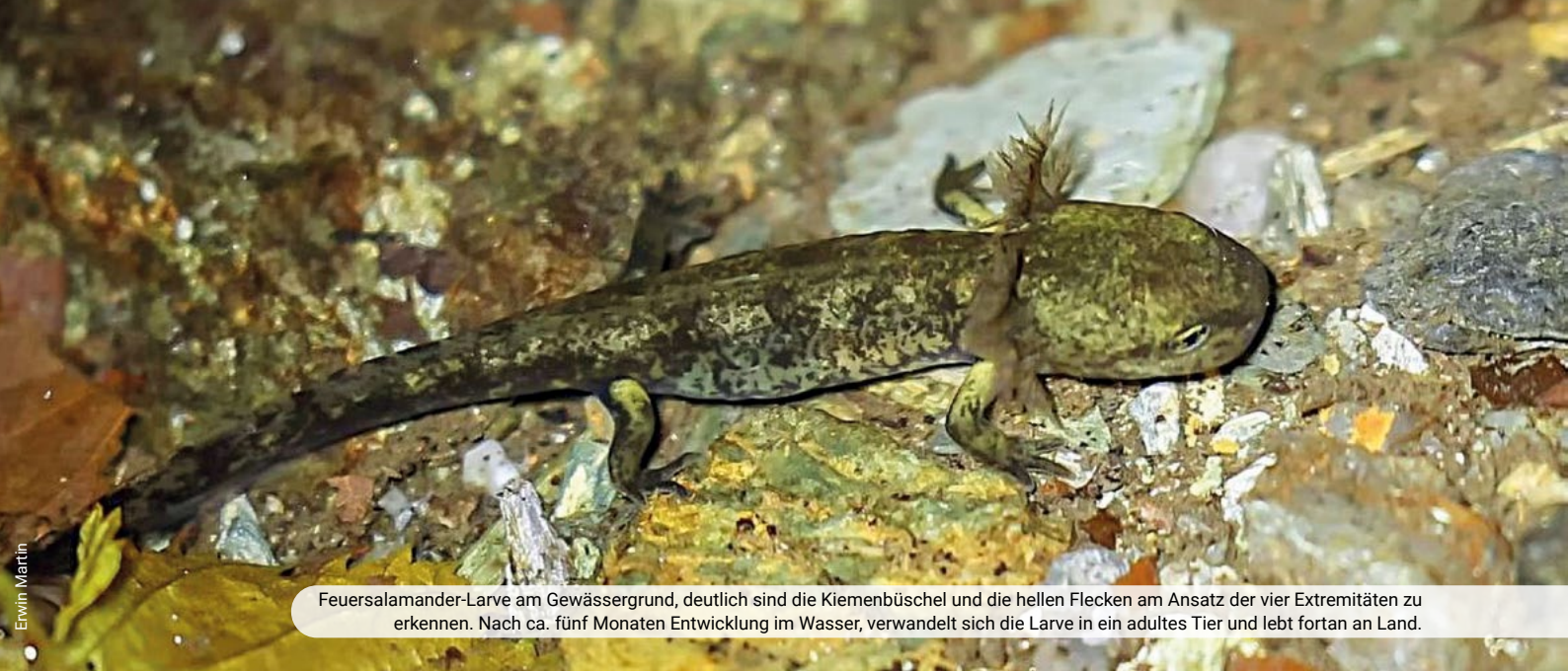
Feuersalamander-Larve am Gewässergrund, deutlich sind die Kiemenbüschel und die hellen Flecken am Ansatz der vier Extremitäten zu erkennen. Nach ca. fünf Monaten Entwicklung im Wasser, verwandelt sich die Larve in ein adultes Tier und lebt fortan an Land.