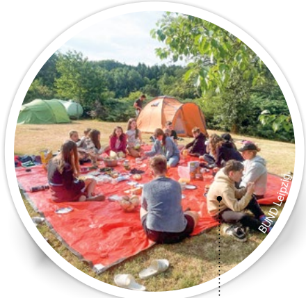
Letztes Jahr beim Sommercamp: Frühstück in gemütlicher Runde

schutzzentrum Pfaffengut an der Talsperre Pöhl. Dort wird gecamped, gebadet und die Natur auf spielerische Weise entdeckt. Außerdem sind Lagerfeuer und viele spannende Abenteuer geplant. Der BUND Leipzig freut sich besonders über dieses Projekt, da Kinder durch die