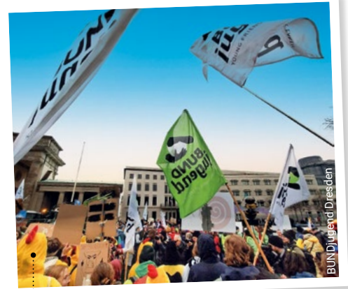
Bei der "Wir-haben-es-satt"-Demo im Januar in Berlin!