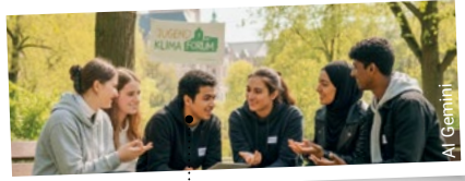
So könnte das neue Jugendklimaforum Leipzig aussehen.

kontakt@bund-leipzig.de www.bund-leipzig.de