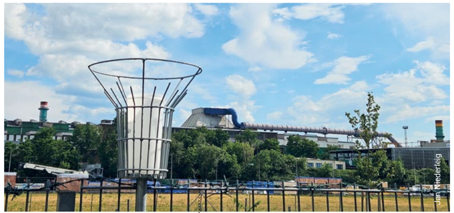
Nach 20 Jahren Streit, nun friedliche Nachbarschaft in Riesa

Durch eine gerichtliche Mediation beim Verwaltungsgericht Dresden ist es gelungen, eine in Riesa seit über zwei Jahrzehnten bestehende Konfliktsituation zwischen einzelnen angrenzenden Anwohnern, dem Unternehmen FERALPI STAHL, das am Standort ein Stahlwerk und zwei Walzwerke betreibt, und dem Freistaat Sachsen einvernehmlich zu beenden.