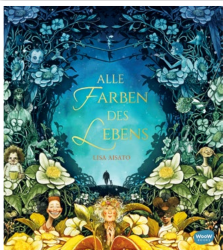
Herausgeber: WooW Books Erschienen 2020