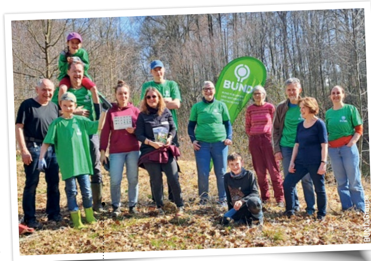
Im Einsatz für den Naturschutz: Die Aktiven der BUND Ortsgruppe Graupa

Gegründet wurde die BUND-Ortsgruppe Graupa, Mitglied der Regionalgruppe Gesunde Zukunft im BUND Sachsen e.V., im Oktober 1994. Seither engagieren sich die Ehrenamtlichen für den Schutz und die Entwicklung wertvoller Lebensräume vor Ort. Ein besonderer Schwerpunkt ist jedes Jahr der Amphibienschutz: Mit dem Aufbau eines Amphibienzauns werden Kröten, Frösche und Molche davor bewahrt, auf ihrem Weg zu den Laichgewässern auf der Straße zu sterben. Die entlang des Zauns eingegrabenen Eimer werden ein- bis zweimal täglich kontrolliert und geleert – eine Aufgabe, die Verlässlichkeit und Ausdauer erfordert.