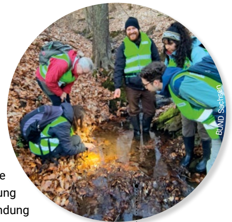
Das Feuersalamander-Monitoring findet meist abends bei Regen statt.

oder Bürgerwissen-schaftler:in aktiv werden. Jeder Fund hilft, die Verbreitung der Art zu erfassen und ihre Lebensräume zu schützen. Eine Anleitung zur Installation und Anwendung der App bietet der BUND Sachsen unter: