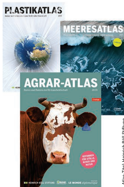
Atlas-Titel: Heinrich-Böll Stiftung