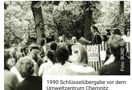
1990 Schlüsselübergabe vor dem Umweltzentrum Chemnitz

Heute ist der BUND Sachsen e.V. auf dem Weg zum 10.000sten Mitglied. Die Landesgeschäftsstelle befindet sich in Chemnitz - hinzu kamen das Hauptstadt-