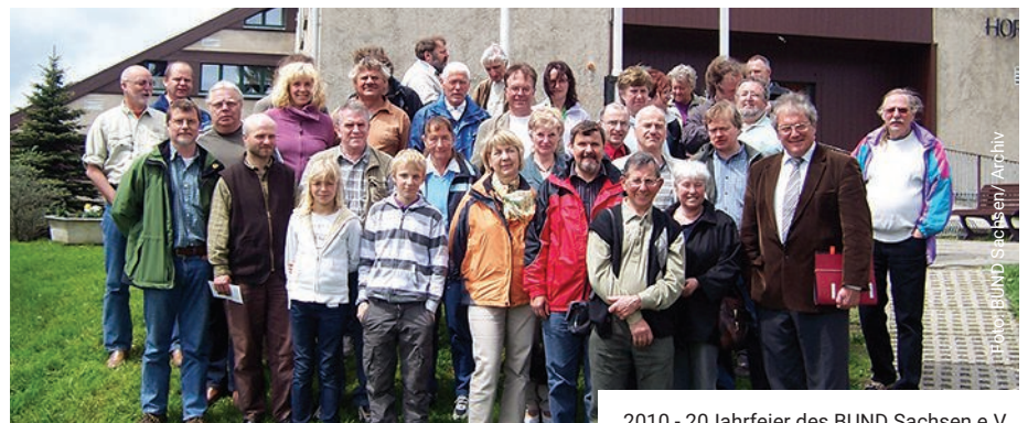
2010 - 20Jahrfeier des BUND Sachsen e.V.