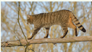
Typisches Merkmal der Wildkatzen ist der buschige Schwanz mit den dunklen Ringen.