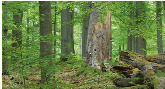
Wildkatzen leben in naturnahen, strukturreichen Laub- und Mischwäldern.

Bei der Wahl ihres Lebensraums sind Wildkatzen sehr anspruchsvoll. Totholzhaufen und Wurzelteiler für die Jungenaufzucht, kleine Lichtungen und Wiesen für die Mäusejagd, Säume am Waldrand - je vielfältiger der Wald, desto wohler fühlen sich dort Wildkatzen. Wo Gebüsche und Hecken ihnen Deckung bieten, wagen sie sich aus dem Wald heraus. Auch eine strukturreiche, durch Feldgehölze vernetzte Kulturlandschaft wird von der Wildkatze als Lebensraum angenommen.