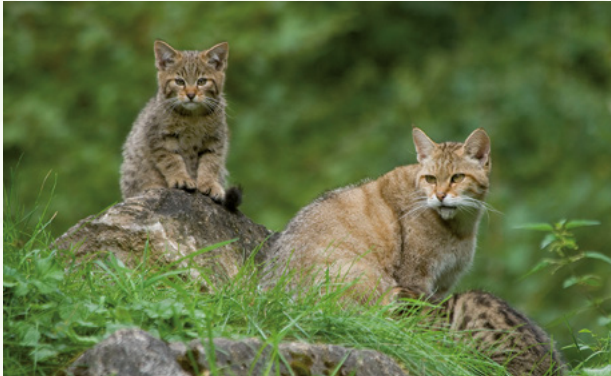
Wildkatzen gab es einst flächendeckend in Deutschland.

Auf sanften Pfoten schleichen sie durch den Wald, verstecken sich scheu in Baumhöhlen oder zwischen Totholz. Sie leben zurückgezogen vor allem in naturnahen Laub- und Mischwäldern. Meist schlafen sie tagsüber und jagen nachts. Nur wenige wissen, dass es sie überhaupt noch gibt und kaum einer bekommt sie je zu Gesicht - die Europäischen Wildkatzen ( Felis silvestris silvestris ).