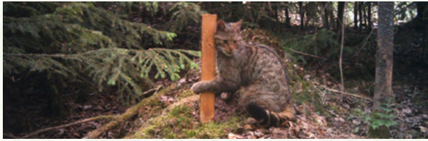
Mit Hilfe von Lockstockkontrollen und vielen Freiwilligen ist der BUND der Wildkatze auf der Spur.

Der BUND baut eine bundesweite Gendatenbank für die Wildkatze auf, die dazu beitragen soll, die Vernetzungspläne zu verbessern und nachhaltig umzusetzen. Wo kommen Wildkatzen in Sachsen vor? Wie groß ist die genetische Vielfalt innerhalb einer Population? Diese und weitere Fragen sollen anhand von Lockstockuntersuchungen beantwortet werden. Mit Baldrian besprühte Holzpflocke locken vorbeistreifende Wildkatzen insbesondere in der winterlichen Paarungszeit an. Während sie sich genüsslich an dem rauen Holz reiben, verlieren sie Haare, die von vielen Freiwilligen abgesammelt, an das Forschungsinstitut Senckenberg geschickt und dort genetisch analysiert werden. Mit Hilfe der Lockstockmethode konnte der BUND Sachsen Wildkatzen im Leipziger Auwald und in der Dübener Heide nachweisen.